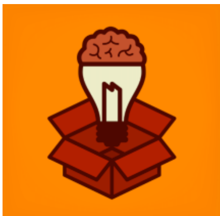
Joonis 2. Mõttele kastist välja (Vecteezy.com, 2020)

Kui kasutatud joonis pärineb mujalt allikast, siis lisatakse joonisele ka allikaviide (vt Joonis 2.)