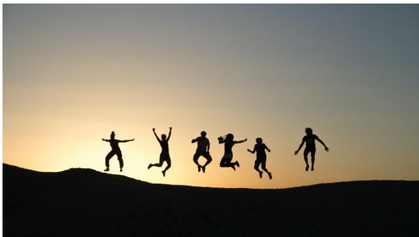
Foto 3. Sõprus. (28.01.2019).

Tabelite vormistus: Iga tabel on nummerdatud araabia numbritega (näiteks Tabel 1., Tabel 2. jne) ning varustatud pealkirjaga, mis paikneb tabeli peal ja mille pealkirja järel punkti ei ole. Tabelite numbreid hakatakse lugema alates esimesest tabelist. Tabeli pealkiri peab olema võimalikult lühike ja selge, kuid samas mõtestama tabeli sisu. Tabelile peab olema uurimistöö sisus viidatud, kas otseselt (nt Alljärgnev tabel 1. iseloomustab...) või kaudselt (näiteks (vt tabel 1.)). Tabelite kasutamine teksti põhiosas (peatükkides) peab olema põhjendatud. Lisasse paigutatud tabeli andmed peavad olema üheselt mõistetavad ka ilma põhiteksti lugemata. Tabelite kujundus peab olema ühtne: (Times New Roman, kirjasuurus 12 või 11, reavahe 1,0). Vaata näidet Tabel 3.