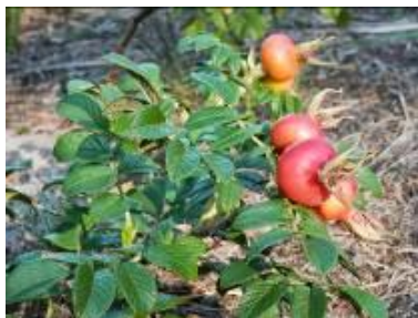
Foto 1. Naissaare kibuvits. (14.09.2013).

Kui fotol on teine autor, aga foto on saadud otse sellelt autorilt, siis koostatakse pildile allkiri järgnevalt: foto pealkiri, foto tegemise kuupäev, kohaandmed, kust foto pärineb – Erakogu.