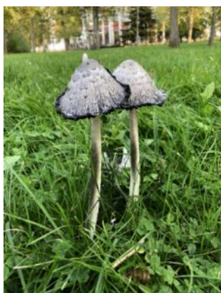
Foto 2. Tindikud. (26.09.2020).